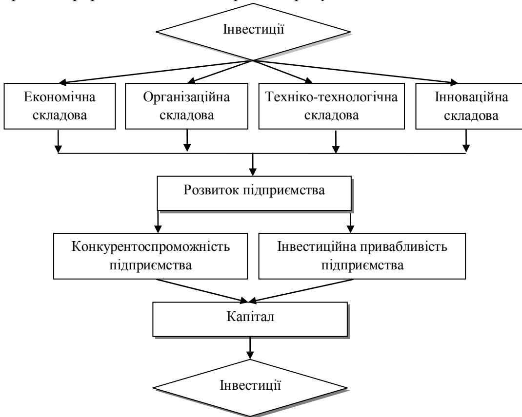
Рис. 1.1. Модель розвитку будівельного підприємства за умов інвестиційної конкуренції*.

Зразки оформлення схем, діаграм та рисунків: