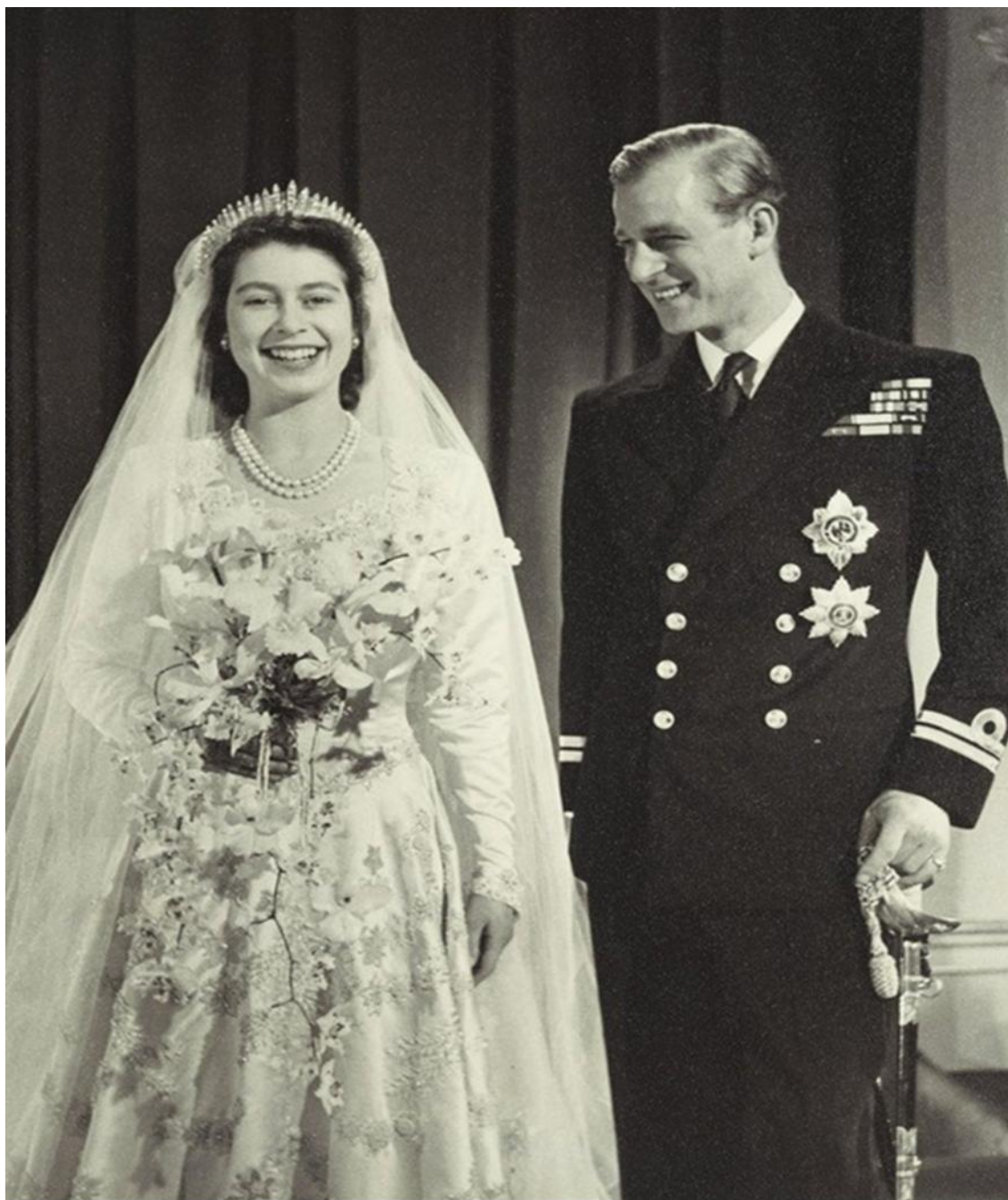
Весілля принцеси Єлизавети II і принца Філіпа, 20 листопада 1947 р.