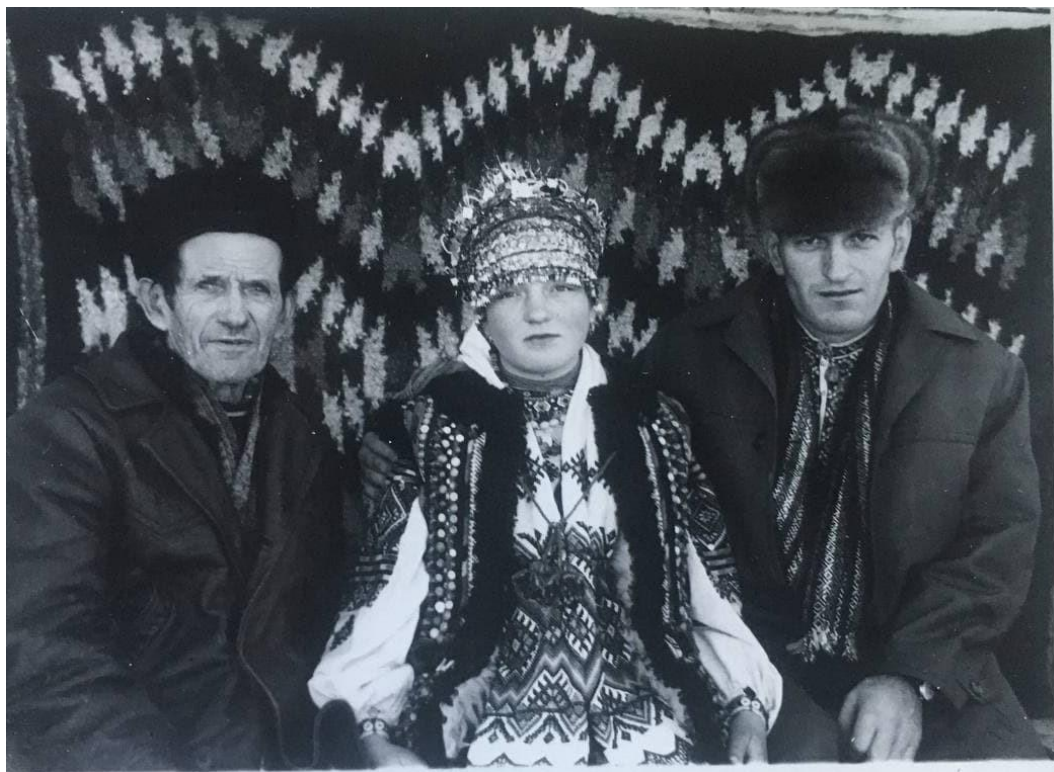
Фото 6. Гуцульське весілля 1975 р.